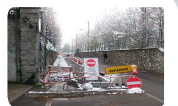
Nuova pista ciclabile in via Roma