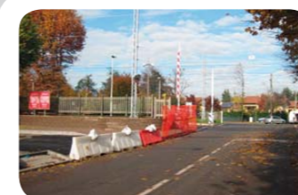
Lavori piazzale stazione lato sud