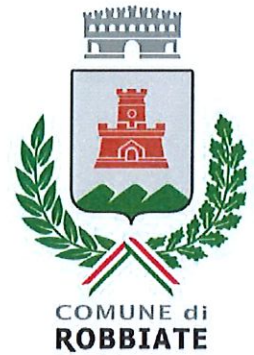
COMUNE di ROBBIATE