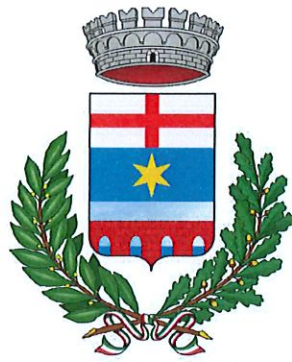
Comune di Paderno d'Adda