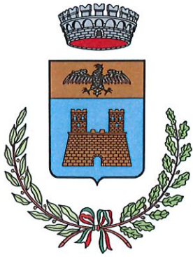
Comune di Imbersago